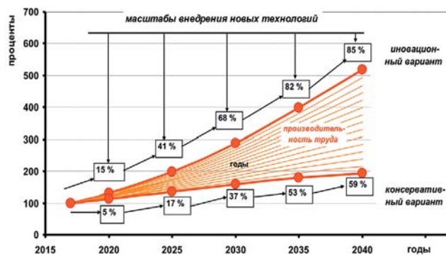
Рис. 3 Прогноз роста производительности труда в угольной отрасли РФ в зависимости от масштабов применения новых технологий

Более чем пятикратное повышение к 2040 г. (относительно 2017 г.) производительности труда в инновационном варианте в угольной отрасли обеспечивается высоким уровнем (до 85%) технологического обновления угольной отрасли, достигаемым, прежде всего, за счет технологий, входящих в «ядро» (рис. 3).